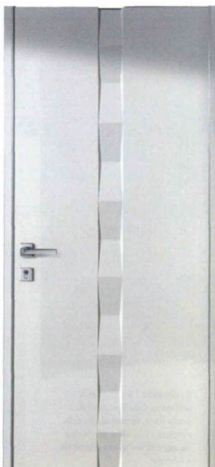
È in versione scolpita in bassorilievo la blindata Flat di Alias, con una fascia che ne percorre il pannello in verticale donando movimento alla superficie con finitura laccata in vari colori. Design Roberto Tortellotti