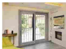
DEFENDER D300 Alias Security Doors Inferriata di sicurezza