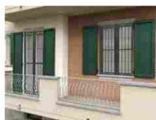
DEFENDER D100 Alias Security Doors Inferriata di sicurezza in metallo